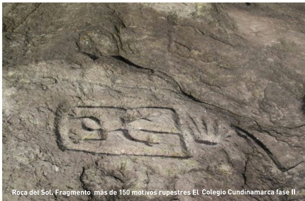
Roca del Sol. Fragmento más de 150 motivos rupestres El Colegio Cundinamarca fase II

E n abril de 2012 se reiniciaron los trabajos de prospección, registro y documentación del municipio de El Colegio. Esta nueva etapa permitirá revisar nuevamente algunas de las áreas, que no habían sido visitadas. En estos pocos meses se han podido ubicar un número importante de rocas (15). Una de ellas en especial (Piedra del SOL) además de contener no menos de 150 motivos, fue realizada con surcos muy profundos, estructuras formales nuevas y una estética, que sin duda manifiesta un alto grado de síntesis y una elaboración derivada de técnicas estables