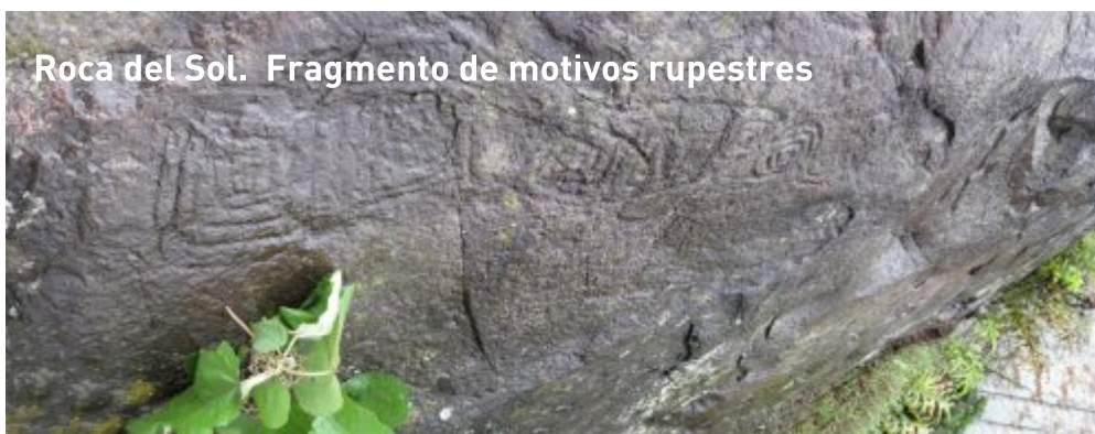
Roca del Sol. Fragmento de motivos rupestres