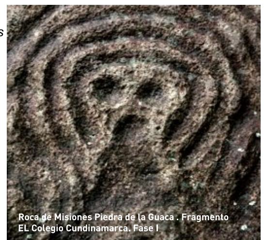
Roca de Misiones Piedra de la Guaca . Fragmento EL Colegio Cundinamarca. Fase I