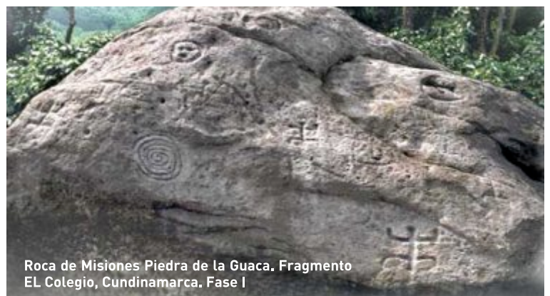
Roca de Misiones Piedra de la Guaca. Fragmento EL Colegio, Cundinamarca. Fase I

Tradiciones arqueológicas. “Desde la conquista hasta nuestros días, se han generado un conjunto problemático de explicaciones sobre la distribución de los diferentes grupos indígenas en Colombia. Cuando se iniciaron los primeros trabajos de investigación en arte rupestre se notó que los hallazgos, producto del trabajo de campo, no encajan en las antiguas versiones de zonas arqueológico culturales. En primer lugar, la imagen salvaje de las etnias descritas en la crónica, difieren en forma absoluta con las obras de arte encontradas, pues sus estructuras formales son ejemplos de un mundo cultural y estético refinado y complejo, probablemente como resultado de unas técnicas, estabilizadas por años y compartidas probablemente en amplios territorios. Lo cierto es que quien se educa en estas versiones tradicionales, no nota que en su educación se ha suprimido la diversidad, y en cambio se le ha impuesto un conjunto de juicios de valor, una imagen ingenua sobre las características bárbaras de las comunidades de tierra caliente( Panches). Acostumbrados a imaginar la realidad sin procesos, entendemos siempre que estas zonas fueron relativamente baldías, y que fueron civilizadas con la presencia de los colonizadores del siglo XVIII y XIX, con la fundación de las antiguas haciendas paneleras y las primeras empresas cafeteras, se civilizó este amplio territorio” (Frag. Historia y hallazgos, Muñoz 2006 )