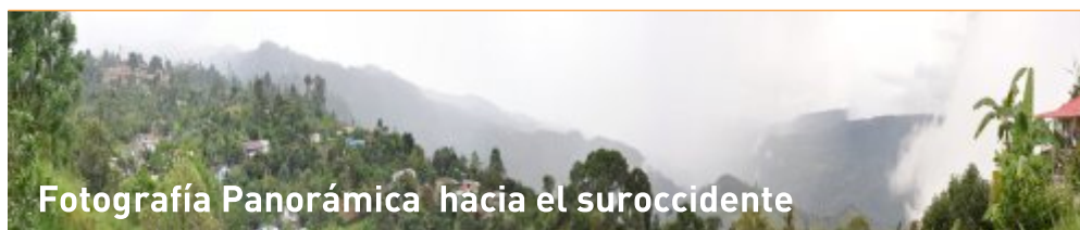
Fotografía Panorámica hacia el suroccidente